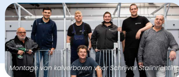
Montage van kalverboxen voor Schrijver Stalinrichting