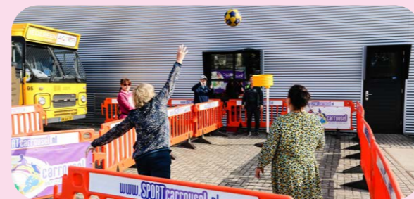
Het beweegplein tijdens de Vitaliteitsweek